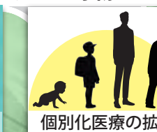
個別化医療の拡充