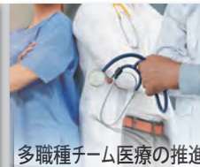
多職種チーム医療の推進