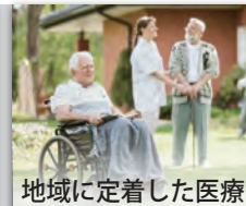
地域に定着した医療