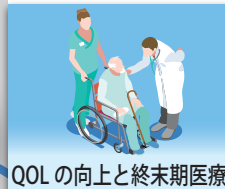
QOLの向上と終末期医療