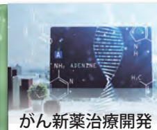
がん新薬治療開発