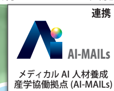
連携 AI-MAILs メディカル AI 人材養成 産学協働拠点 (AI-MAILs)