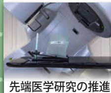
先端医学研究の推進