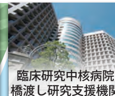
臨床研究中核病院 橋渡し研究支援機関